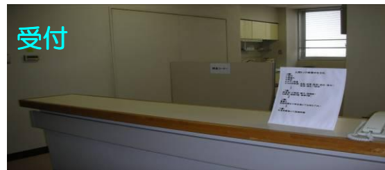
⑧新館4階でお降りいただくとすぐ前に専用受付 があります。