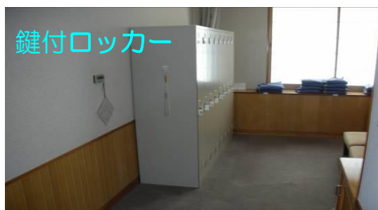
⑨更衣室で検査衣に着替え