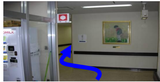
④売店を通り過ぎ左手方向に