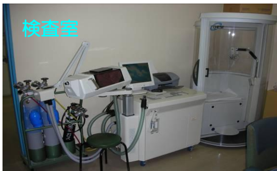
⑭肺機能・尿・心電図・聴力検査