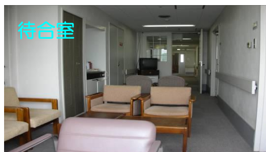
⑩待合室へ(各種お飲み物を用意しております、検査後自由にお飲みください)