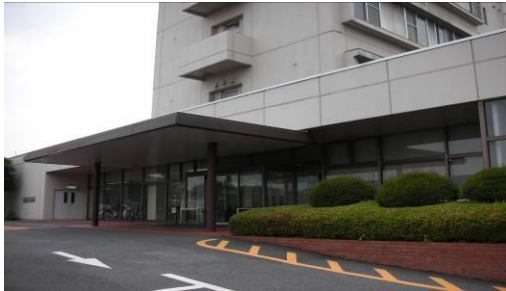
①正面玄関(玄関前に駐車場があります)