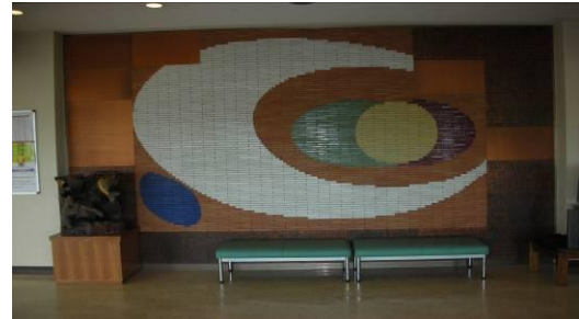
②正面玄関内エントランス 〈思いやりの心〉モザイク壁画