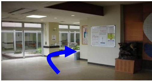
③エントランス左手より右奥に進む(柱の→方向)