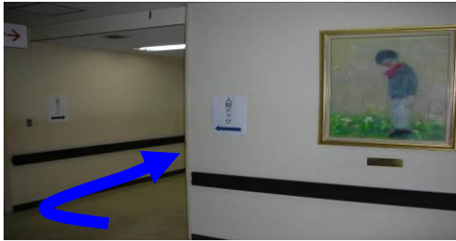
⑤すぐ右に折れ奥に進む(柱の→方向)