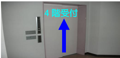
⑦新館エレベーターホール 4階までお上がりください。